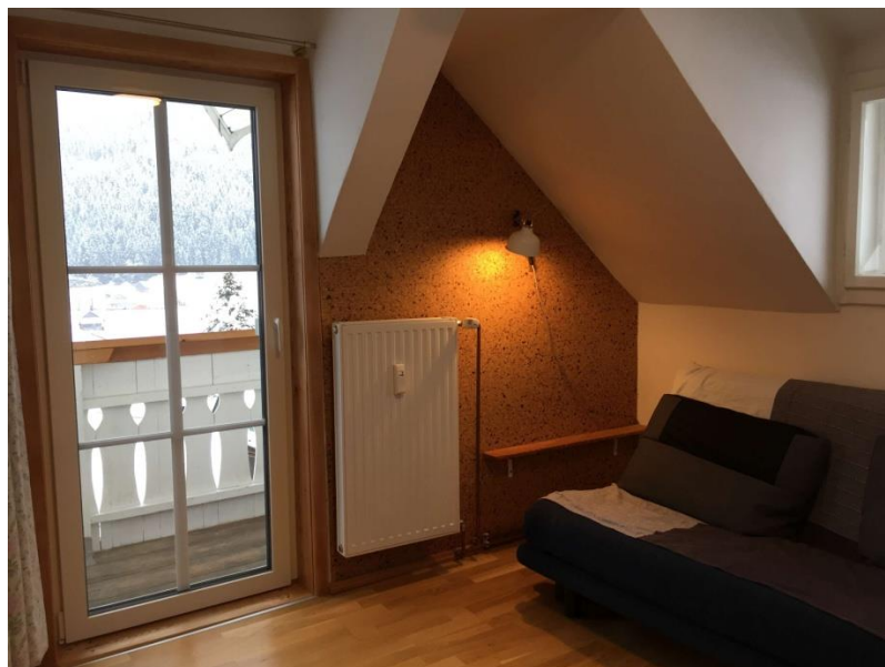
Wohnküche mit Schlafsofa /Kitchen