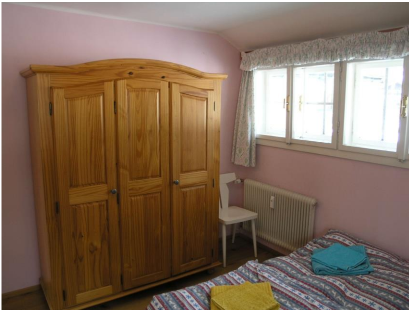
Schlafzimmer / Bedroom