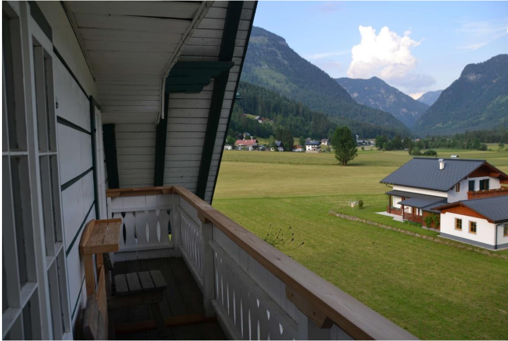
Balkon / Balcony

Eingebettet zwischen dem Dachstein mit seinem Gletscher, dem Gosaukamm, dem Kalmberg und dem Plassen befindet sich das Gosautal auf ca. 740 Meter Seehöhe im Salzkammergut, einer erd-, natur- und kulturgeschichtlich interessanten und spannenden Region Österreichs.